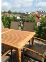
Terrasse mit Garten