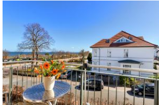
Balkon mit Ausblick