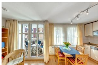
großzügiger Essbereich und Küche

Direkt an der Strandpromenade mit SÜDBALKON und FAHRSTUHL im Haus! Schönes geräumiges 2-Zimmer-Apartment mit moderner guter Ausstattung. Separates Schlafzimmer, Wohnzimmer mit Küchenzeile und Essplatz, Duschbad, Balkon nach Süden mit Sonne bis abends. Die Wohnung verfügt über einen Tiefgaragen-Pkw-Stellplatz. In der Garage können auch Fahrräder und ähnliches untergestellt werden. In unserer "Villa Germania" nebenan gibt es eine Sauna. Von der "Villa Aquamarina" aus können Sie das Ortszentrum und die bekannte Ahlbecker Seebrücke in ca. 3 Minuten zu Fuß erreichen. Zum Strand sind es 50 m.