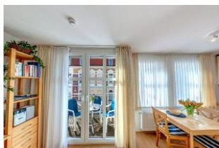
Essbereich mit Blick auf die Terrasse