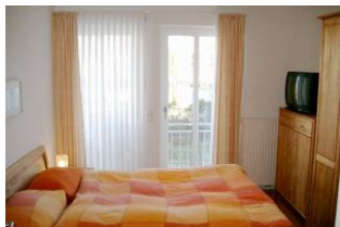
Schlafzimmer mit Balkonzugang