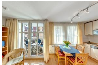
großzügiger Essbereich und Küche

Direkt an der Strandpromenade mit SÜDBALKON und FAHRSTUHL im Haus! Schönes geräumiges 2-Zimmer-Apartment mit moderner guter Ausstattung. Separates Schlafzimmer, Wohnzimmer mit Küchenzeile und Essplatz, Duschbad, Balkon nach Süden mit Sonne bis abends. Die Wohnung verfügt über einen Tiefgaragen-Pkw-Stellplatz. In der Garage können auch Fahrräder und ähnliches untergestellt werden. In unserer "Villa Germania" nebenan gibt es eine Sauna. Von der "Villa Aquamarina" aus können Sie das Ortszentrum und die bekannte Ahlbecker Seebrücke in ca. 3 Minuten zu Fuß erreichen. Zum Strand sind es 50 m.