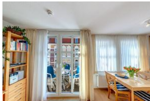
Essbereich mit Blick auf die Terrasse