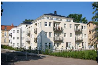
Hausansicht "Villa Aquamarina" von der Promenade