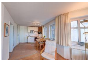
heller Wohnbereich mit Fernseher