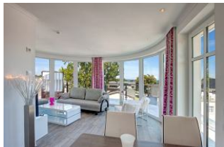
Blick in den Wohnraum

SEHR MODERN und mit SEEBLICK aus dem Wohnraum mit GROSSER FENSTERFRONT zur SEESEITE und von der GROSSEN DACHTERRASSE (ca. 55 qm mit Strandkorb und Möbeln). Mit FAHRSTUHL, nur ca. 100 m zur Strandpromenade! Luxuriös und komfortabel eingerichtete 2 - Zimmer - Wohnung mit sehr guter Ausstattung! Separates Schlafzimmer, ein zum Schlafzimmer offenes Bad mit großer walk-in-Dusche und Badewanne, ein separates WC. Der große Wohnbereich besticht durch eine gerundete Fensterfront und einen schönen Küchen- und Eßbereich, sowie einen KAMINOFEN. Die Wohnung verfügt über FUSSBODENHEIZUNG. Sie nimmt mit der großen Dachterrasse das gesamte Dachgeschoß des hinteren (seeseitigen) Hausteils ein. Zur Wohnung gehört ein STRANDKORB AM STRAND. Sie verfügt über einen Pkw-Stellplatz in der teilüberdachten Tiefgarage. Fahrradabstellfläche ist vorhanden. Vom Haus aus können Sie das Ortszentrum und die Ahlbecker Seebrücke in ca. 2 Minuten zu Fuß erreichen.