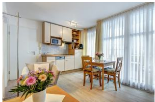
Küche, Wssen, Wohnen

1. Reihe, direkt an der Strandpromenade mit SÜDBALKON! FAHRSTUHL im Haus! Schönes 2-Zimmer-Apartment mit moderner guter Ausstattung. Separates Schlafzimmer (mit Fernseher), Wohnzimmer mit Küchenzeile mit Essplatz, Duschbad, Balkon zur Südseite mit Sonne bis abends. Die Wohnung verfügt über einen Pkw-Stellplatz. In der Garage können auch Fahrräder und ähnliches untergestellt werden. Von der "Villa Aquamarina" aus können Sie das Ortszentrum und die bekannte Ahlbecker Seebrücke in ca. 3 Minuten zu Fuß erreichen. Zum Strand sind es 50 m.