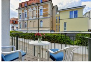
Balkon nach Süden