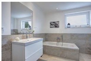
Badezimmer mit Dusche und Wanne