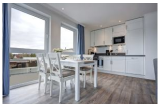
Essplatz und Küche