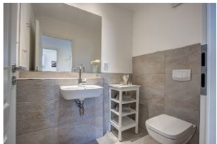
separates Gäste WC