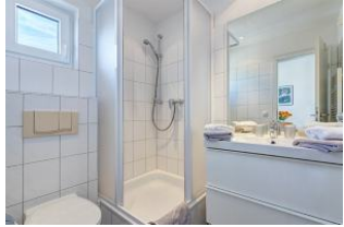
Duschbad mit kleinem Fenster