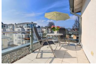
Dachterrasse nach Süden mit Essplatz