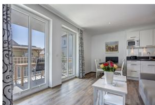
Blick zum Balkon