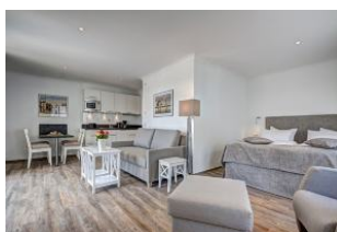
Blick zum Bett und zur Couch