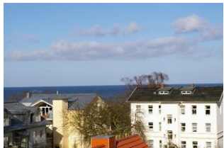
Seeblick Ostseewarte Nr. 17