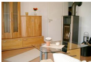
Wohn-/Schlafzimmer mit Kaminofen und Schlafcouch (140 cm) für 5. und (wenn gewünscht) 6. Person