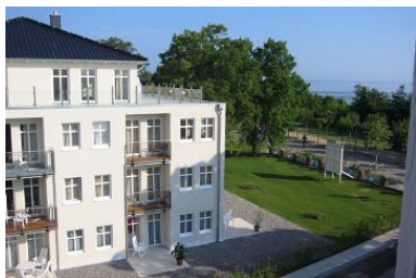
Hausansicht "Villa Aquamarina" von der Südseite (Nachbarhaus)