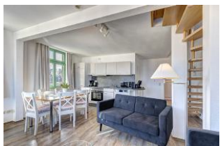
Wohnen / Essen / Küche