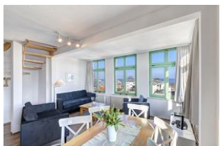
Wohnen / Essen / Aufgang

STRANDNAH mit SEEBLICK und BALKON! Nur ca. 100 m zur Strandpromenade! FAHRSTUHL im Haus. Schönes großes Maisonette-Apartment mit 4 Zimmern auf zwei Ebenen, gute Ausstattung. 3 Schlafzimmer, Wohnzimmer mit vollwertiger Küchenzeile und Essplatz, Duschbad (untere Ebene), Wannenbad (obere Ebene), zus. Gäste-WC, Eingangsflur, Balkon. Die Wohnung verfügt über einen Pkw-Stellplatz. Seeblick über die vorstehenden Häuser hinweg. Abstellraum für Fahrräder und ähnliches ist vorhanden. Vom Haus aus können Sie das Ortszentrum und die bekannte Ahlbecker Seebrücke in ca. 3 bzw. 5 Minuten zu Fuß erreichen.