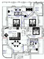
Wohnungsgrundriss (Möblierung exemplarisch)

STRANDNAH, GROSS, MODERN! Mit 2 BALKONEN (je ca. 8 qm), FAHRSTUHL, nur ca. 100 m zur STRANDPROMENADE! Großzügige elegante 4 - Zimmer - Wohnung mit sehr guter Ausstattung! 3 separate Schlafzimmer, 3 Bäder (2 davon ensuite), alle mit Fußbodenheizung. Die ensuite-Bäder verfügen über Wanne und Dusche bzw. Dusche. Das dritte Bad ist ein Duschbad. Der große Wohnbereich verfügt über eine vollausgestattete Küchenzeile, einen Eßbereich und einen Couchbereich mit KAMINOFEN. Die Balkone sind möbliert. Zur Wohnung gehört ein STRANDKORB AM STRAND. Die Wohnung verfügt über einen Pkw-Stellplatz in der teilüberdachten Tiefgarage. Fahrradstellfläche ist vorhanden. Vom Haus aus können Sie das Ortszentrum und die bekannte Ahlbecker Seebücke in ca. 2 Minuten zu Fuß erreichen.