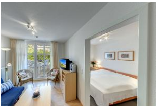
Blick in das Schlafzimmer