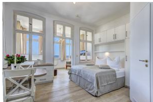
Blick in die Wohnung mit Seeblick

Direkt an der Strandpromenade mit herrlichem SEEBLICK aus der Veranda! Schönes 2 - Zimmer - Apartment mit gemütlicher und guter Ausstattung. Kombiraum mit Doppelbett, Küchenzeile mit Essplatz, Duschbad und Veranda als Wohnraum mit direktem Seeblick. Die Wohnung verfügt über einen Pkw-Stellplatz. In der Garage können Fahrräder und ähnliches untergestellt werden. Im Haus gibt es eine Sauna. Von der "Villa Germania" aus können Sie das Ortszentrum und die bekannte Ahlbecker Seebrücke in ca. 3 Minuten zu Fuß erreichen. Zum Strand sind es 50 m. Von Mai bis September ist ein Strandkorb im Tagespreis enthalten.