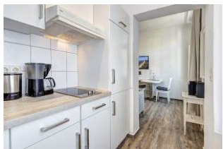
Blick aus der offenen Küche zum Essbereich