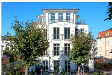
Hausansicht aus der Architektenplanung