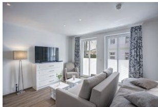
Flachbild TV und Couch