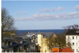
Seeblick aus der Veranda Ostseewarte Nr. 14