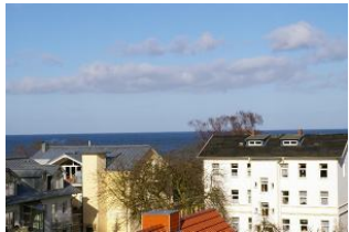
Seeblick Ostseewarte Nr. 17