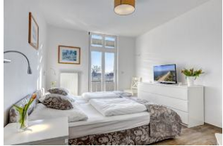
Schlafzimmer mit Zugang zum Balkon