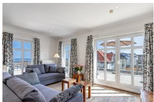
Wohnbereich mit Meerblick

1. Reihe, PENTHOUSE direkt an der Strandpromenade mit SEEBLICK, DACHTERRASSE und FAHRSTUHL im Haus! Chices geräumiges 3-Zimmer-Apartment mit moderner hochwertiger Ausstattung. Zwei separate Schlafzimmer, Wohnzimmer mit Küchenbereich und Essplatz, Duschbad, 45 qm Dachterrasse über Eck nach Osten und Süden mit Sonne von morgens bis abends und herrlichem Seeblick. Die Wohnung verfügt über einen Tiefgaragen-Pkw-Stellplatz. In der Garage können auch Fahrräder und ähnliches untergestellt werden. In unserer "Villa Germania" nebenan gibt es eine Sauna. Von der "Villa Aquamarina" sind es zum Ortszentrum und der Seebrücke ca. 3 Minuten zu Fuß. Zum Strand sind es 50 m.