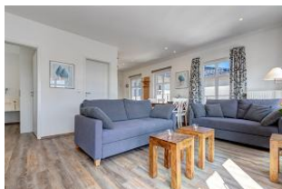
Wohnbereich mit Blick zum Essplatz