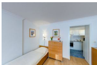
Schlafmöglichkeit für 3. Person