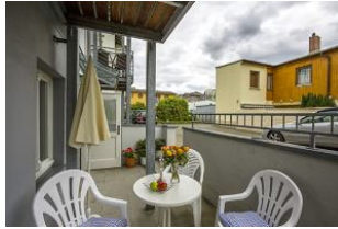
Eigene kleine Terrasse