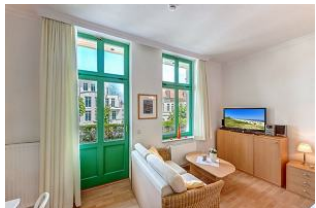
Kombinierter Wohn- / Schlafraum

STRANDNAH! Nur ca. 100 m zur Strandpromenade mit BALKON! Gemütliches 1-Zimmer-Apartment mit guter Ausstattung. Geräumiger Wohn-/Schlafraum mit Doppelbett und Sitz-/Sofaecke, Küchenzeile mit Essplatz, Duschbad, kleiner Vorflur, Balkon. Die Wohnung verfügt über einen Pkw-Stellplatz. Abstellraum für Fahrräder und ähnliches ist vorhanden. Eine Sauna in der "Villa Germania" kann kostenpflichtig genutzt werden. Vom Haus aus können Sie das Ortszentrum und die bekannte Ahlbecker Seebücke in ca. 3 bzw. 5 Minuten zu Fuß erreichen.