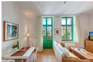
Küchenzeile und Eßplatz