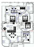
Wohnungsgrundriss (Möblierung exemplarisch)

STRANDNAH, GROSS, MODERN! Mit 2 BALKONEN (je ca. 8 qm), FAHRSTUHL, nur ca. 100 m zur STRANDPROMENADE! Großzügige elegante 4 - Zimmer - Wohnung mit sehr guter Ausstattung! 3 separate Schlafzimmer, 3 Bäder (2 davon ensuite), alle mit Fußbodenheizung. Die ensuite-Bäder verfügen über Wanne und Dusche bzw. Dusche. Das dritte Bad ist ein Duschbad. Der große Wohnbereich verfügt über eine vollausgestattete Küchenzeile, einen Eßbereich und einen Couchbereich mit KAMINOFEN. Die Balkone sind möbliert. Zur Wohnung gehört ein STRANDKORB AM STRAND. Die Wohnung verfügt über einen Pkw-Stellplatz in der teilüberdachten Tiefgarage. Fahrradstellfläche ist vorhanden. Vom Haus aus können Sie das Ortszentrum und die bekannte Ahlbecker Seebücke in ca. 2 Minuten zu Fuß erreichen.