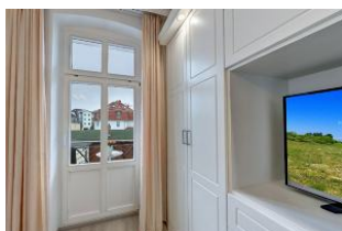
Flachbildfernseher im Schlafzimmer