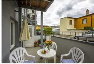
Eigene kleine Terrasse