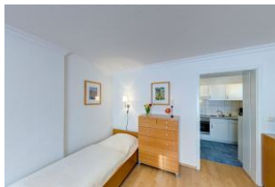
Schlafmöglichkeit für 3. Person