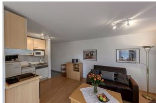
Küche und Wohnbereich