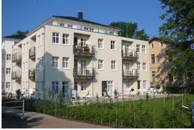
Hausansicht "Villa Aquamarina" von der Promenade mit Garten und Terrassen