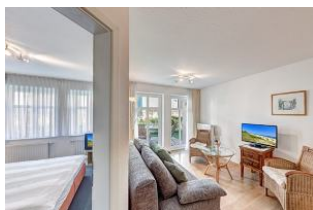
Türe zum Schlafzimmer