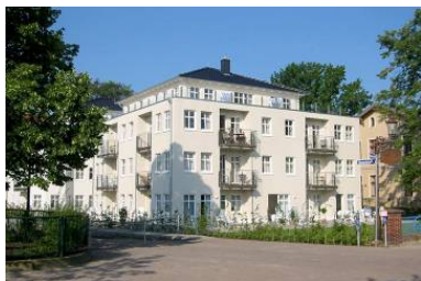
Hausansicht "Villa Aquamarina" von der Promenade