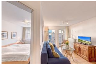
Blick in den Wohnraum