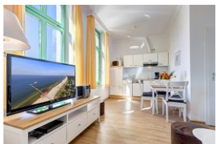
Wohnbereich mit Blick zu Küchenzeile und Essplatz