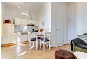
Wohnbereich mit Blick zu Küchenzeile und Essplatz