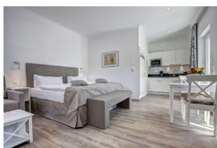
Wohn- und Schlafraum