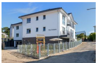
Essplatz und Küchenzeile