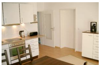
Gut ausgestattete Küche mit großem Essplatz

Strandnah mit SÜDTERRASSE, Balkon und KAMINOFEN! Großzügige und gut ausgestattete 3-Zimmer-Wohnung mit zwei separaten Schlafzimmern, großer Küche mit Eßplatz, Wohn-/Schlafzimmer mit Kaminofen und 140 cm Schlafcouch für die 5. Person, Bad mit Wanne und Dusche, zusätzliches Duschbad, Eingangsflur. Die Wohnung hat einen separaten Eingang. Vom Haus aus können Sie das Ortszentrum und die bekannte Ahlbecker Seebrücke in ca. 3 Minuten zu Fuß erreichen. Zum Strand sind es ca. 80 m Luftlinie. Für Brennholz muß - wenn Kaminofennutzung gewünscht ist - selbst gesorgt werden (im nahegelegenen Supermarkt oder bei uns erhältlich). Diese Wohnung verfügt nicht über WLAN.