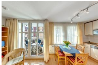
großzügiger Essbereich und Küche

Direkt an der Strandpromenade mit SÜDBALKON und FAHRSTUHL im Haus! Schönes geräumiges 2-Zimmer-Apartment mit moderner guter Ausstattung. Separates Schlafzimmer, Wohnzimmer mit Küchenzeile und Essplatz, Duschbad, Balkon nach Süden mit Sonne bis abends. Die Wohnung verfügt über einen Tiefgaragen-Pkw-Stellplatz. In der Garage können auch Fahrräder und ähnliches untergestellt werden. In unserer "Villa Germania" nebenan gibt es eine Sauna. Von der "Villa Aquamarina" aus können Sie das Ortszentrum und die bekannte Ahlbecker Seebrücke in ca. 3 Minuten zu Fuß erreichen. Zum Strand sind es 50 m.