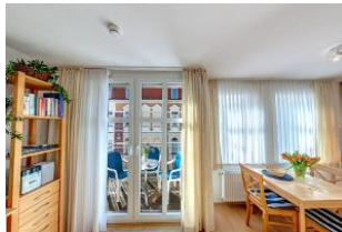
Essbereich mit Blick auf die Terrasse