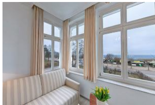
Blick aus Veranda