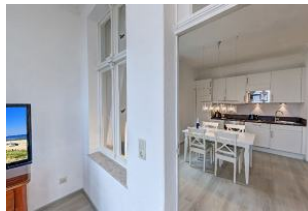
Blick in die Wohnküche