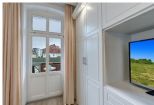
Flachbildfernseher im Schlafzimmer