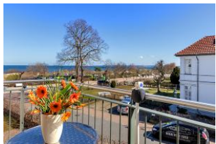
Balkon mit Ausblick