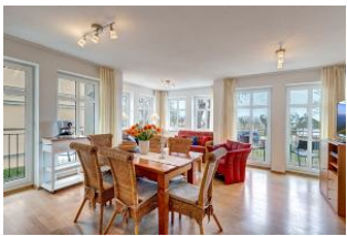
Essplatz und Blick zum Wohnbereich

1. Reihe, direkt an der Strandpromenade mit SEEBLICK und FAHRSTUHL im Haus! Geräumiges und geschmackvoll eingerichtetes 3-Zimmer-Apartment mit moderner guter Ausstattung. Zwei separate Schlafzimmer (eines davon mit 2. Fernseher), Wohnzimmer mit Küchenzeile und Essplatz, Bad mit Wanne und Dusche, Gäste-WC, Balkon zur Seeseite mit ausschnittweisem Seeblick, zus. ein kleiner Balkon neben der Küche. Küchenzeile zusätzlich mit Espressomaschine, Wasserkocher, Eierkocher, Mixer, elektr. Zitruspresse. Die Wohnung verfügt über einen Tiefgaragen-Pkw-Stellplatz. Von der "Villa Aquamarina" aus können Sie das Ortszentrum und die bekannte Ahlbecker Seebücke in ca. 3 Minuten zu Fuß erreichen. Zum Strand sind es 50 m.