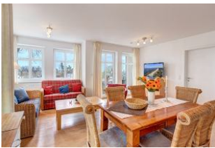
Essplatz und Blick zu Wohnbereich und Balkon