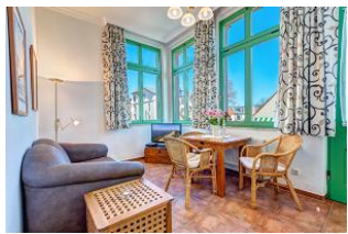
Wohnen und Essen

STRANDNAH! Nur ca. 100 m zur Strandpromenade mit TERRASSE, KLEINEM GARTEN und STRANDKORB! Gemütliches 2-Zimmer-Apartment mit freundlicher Ausstattung. Separates Schlafzimmer, Wohnzimmer mit Schlafcouch, Küchenzeile, Essplatz, geräumiges Duschbad, Terrasse mit Gartenmöbeln und STRANDKORB (Frühling bis Herbst) und kleinem Gartenstück, separater Eingang. Die Wohnung verfügt über einen Pkw-Stellplatz . Abstellraum für Fahrräder und ähnliches ist vorhanden. Eine Sauna in der "Villa Germania" kann kostenpflichtig genutzt werden. Vom Haus aus können Sie das Ortszentrum und die bekannte Ahlbecker Seebrücke in ca. 3 bzw. 5 Minuten zu Fuß erreichen.