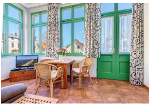
Wohnen und Essen