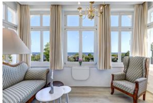
Blick in die Veranda