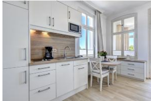
Küchenzeile und Essplatz