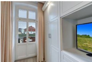
Flachbildfernseher im Schlafzimmer