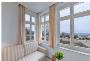
Blick aus Veranda