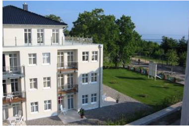
Hausansicht "Villa Aquamarina" von der Südseite