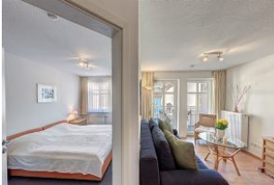
Tür zum Schlafzimmer