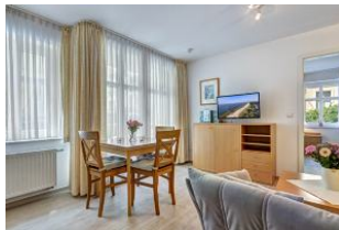
Wohnen, Essen, Blick zum Schlafzimmer