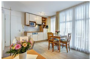
Küche, Wssen, Wohnen

1. Reihe, direkt an der Strandpromenade mit SÜDBALKON! FAHRSTUHL im Haus! Schönes 2-Zimmer-Apartment mit moderner guter Ausstattung. Separates Schlafzimmer (mit Fernseher), Wohnzimmer mit Küchenzeile mit Essplatz, Duschbad, Balkon zur Südseite mit Sonne bis abends. Die Wohnung verfügt über einen Pkw-Stellplatz. In der Garage können auch Fahrräder und ähnliches untergestellt werden. Von der "Villa Aquamarina" aus können Sie das Ortszentrum und die bekannte Ahlbecker Seebücke in ca. 3 Minuten zu Fuß erreichen. Zum Strand sind es 50 m.