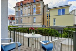
Balkon nach Süden