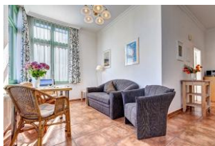
Essen und Wohnen