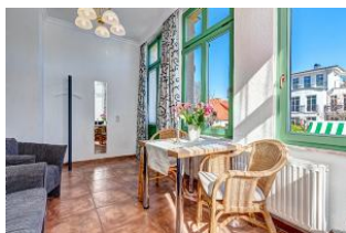
Essen und Wohnen