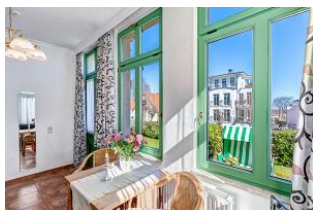
Essplatz mit Blick zur Terrasse mit Strandkorb

STRANDNAH! Nur ca. 100 m zur Strandpromenade mit TERRASSE, KLEINEM GARTEN und STRANDKORB! Gemütliches 2-Zimmer-Apartment mit freundlicher Ausstattung. Separates Schlafzimmer, Wohnzimmer mit Schlafcouch, Küchenzeile, Essplatz, geräumiges Duschbad, Terrasse mit Gartenmöbeln und STRANDKORB (Frühling bis Herbst) und kleinem Gartenstück, separater Eingang. Die Wohnung verfügt über einen Pkw-Stellplatz. Abstellraum für Fahrräder und ähnliches ist vorhanden. Eine Sauna in der "Villa Germania" kann kostenpflichtig genutzt werden. Vom Haus aus können Sie das Ortszentrum und die bekannte Ahlbecker Seebrücke in ca. 3 bzw. 5 Minuten zu Fuß erreichen.