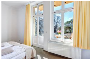
Schlafzimmer mit Blick zum Balkon