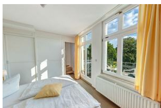
Wohnbereich, Blick in das Schlafzimmer mit Empore

STRANDNAH mit SÜDBALKON! Nur ca. 100 m zur Strandpromenade! Schönes gemütliches Maisonette-Apartment mit 2 Zimmern und zus. Schlafrum auf der Empore, gute Ausstattung. Separates Schlafzimmer, zus. Maisonette-Schlafraum, Wohnzimmer mit Küchenzeile und Essplatz, Duschbad, Südbalkon. Die Wohnung verfügt über einen Pkw-Stellplatz. Abstellraum für Fahrräder und ähnliches ist vorhanden. Eine Sauna in der "Villa Germania" kann kostenpflichtig genutzt werden. Vom Haus aus können Sie das Ortszentrum und die bekannte Ahlbecker Seebrücke in ca. 3 bzw. 5 Minuten zu Fuß erreichen.