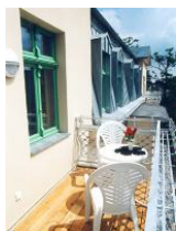
Großer Süd - Balkon