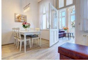
Essbereich und Lesecouch mit Blick zum Wohnbereich in der Veranda