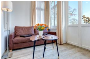
Wohnbereich in der Veranda mit direktem Gartenzugang und dortiger Terrasse