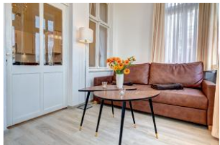
Wohnbereich in der Veranda