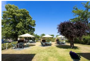
Garten mit Terrassen und Strandkörben (Mai bis September)