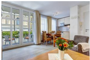
Wohnen, Essen, Küche, Balkon

Direkt an der Strandpromenade mit SÜDBALKON und FAHRSTUHL im Haus! Schönes geräumiges 2-Zimmer-Apartment mit moderner guter Ausstattung. Separates Schlafzimmer (mit Fernseher), Wohnzimmer mit Küchenzeile und Essplatz, Duschbad, Balkon zur Südseite mit Sonne bis abends. Die Wohnung verfügt über einen Tiefgaragen-Pkw-Stellplatz. In der Garage können auch Fahrräder und ähnliches untergestellt werden. Von der "Villa Aquamarina" aus können Sie das Ortszentrum und die bekannte Ahlbecker Seebrücke in ca. 3 Minuten zu Fuß erreichen. Zum Strand sind es 50 m.